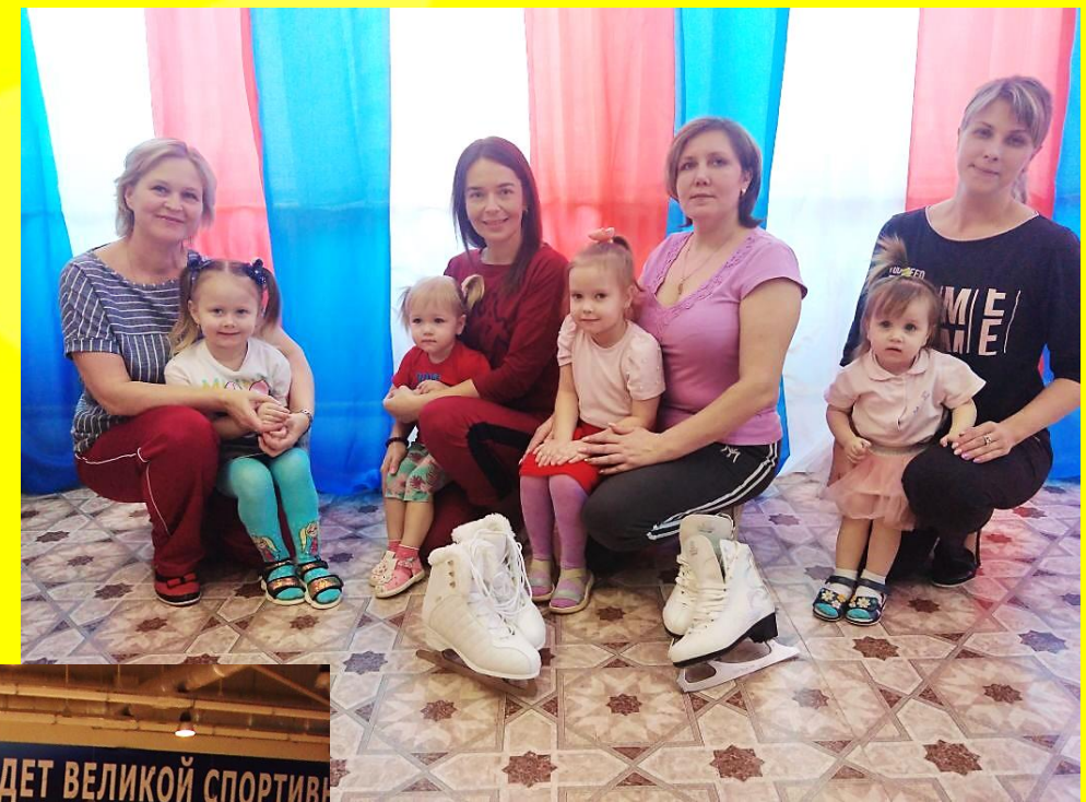
Активные выходные. Все вместе на ледовой арене ФСК «Планета спорта»