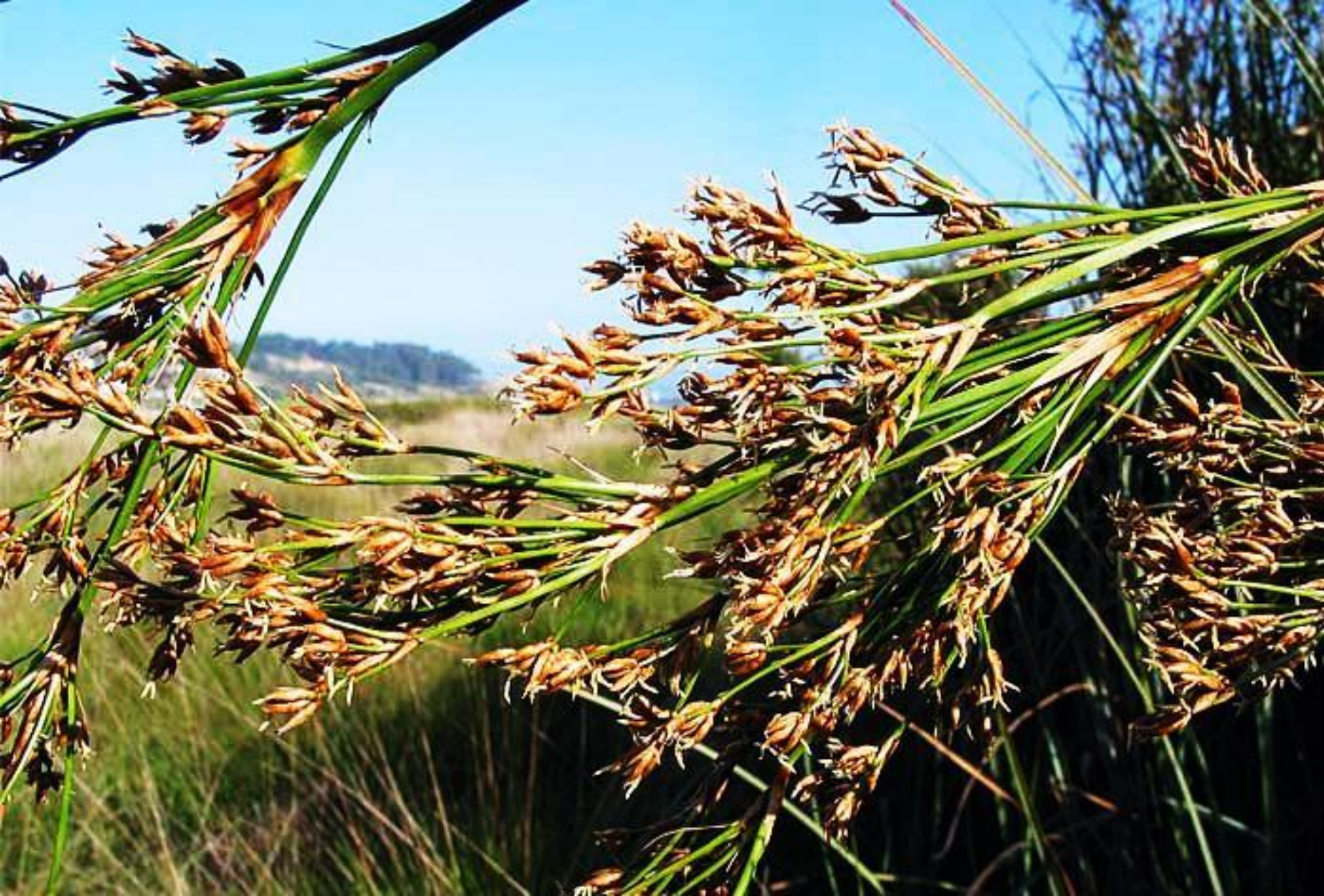
Меч – трава обыкновенная