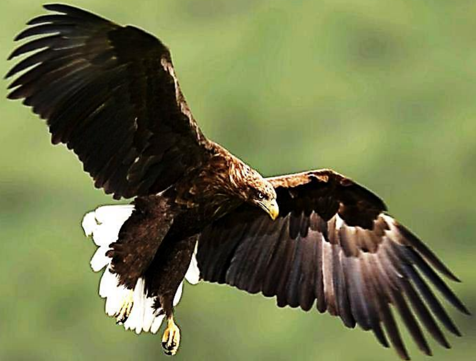
Орлан - белохвост