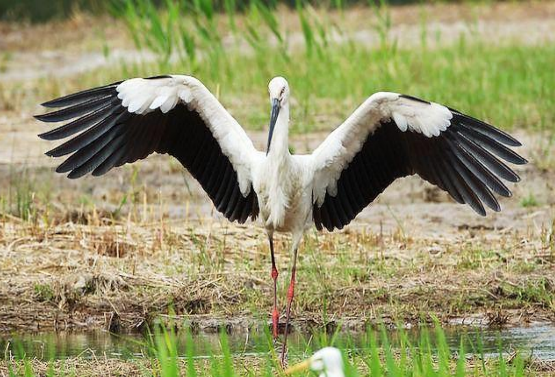
Белый журавль - стерх